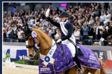
Seit 39 Jahren in Neumünster: Der FEI Dressage World Cup™