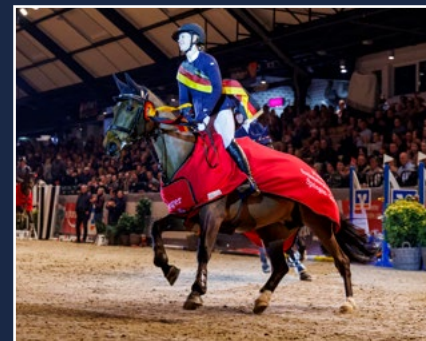
Seit 2024 mit im Programm: Das HGW Bundesnachwuchschampionat